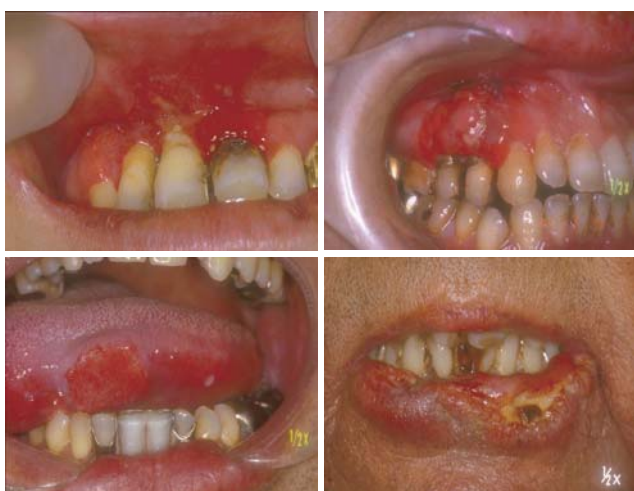
図9 口唇腫瘍のいろいろ