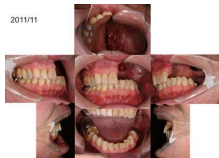
図3 症例：手術後1年顎骨欠損を伴う口腔内状態