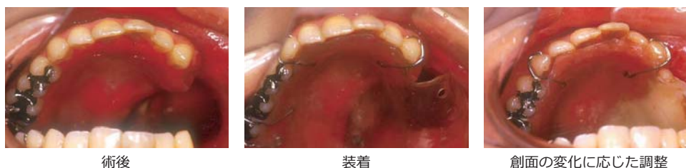
図5 平成28年度改定にて保険収載された手術前に製作し手術直後に装着する術後即時顎補綴装置