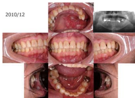
図2 症例：手術前顎義歯外来初診時