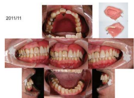
図4 症例：手術後1年補綴装置装着状態

一般的な歯科の診療体制とは異なる特徴をもつ。また、口腔内の状況が患者によって大きく異なり、補綴装置の種類や設計も多種多様である。そのため歯科技工士や歯科衛生士にチェアサイドの情報を正確に伝達し、情報共有を円滑に行うことが重要となる。既に保険収載され症例数も増えている周術期の口腔機能管理や、またさまざまな機能障害の改善のために、言語聴覚士による言語訓練、栄養士による栄養指導を依頼することも有効である。特に軟組織である軟口蓋や舌の機能訓練における言語聴覚士の協力は、中咽頭領域を含む補綴を行う顎義歯外来では欠かせない。従って、若手歯科医師にとっては、診療情報提供書の作成を日常的に行うなど、他職種や他科との連携のスキルを学ぶ良い機会となる。